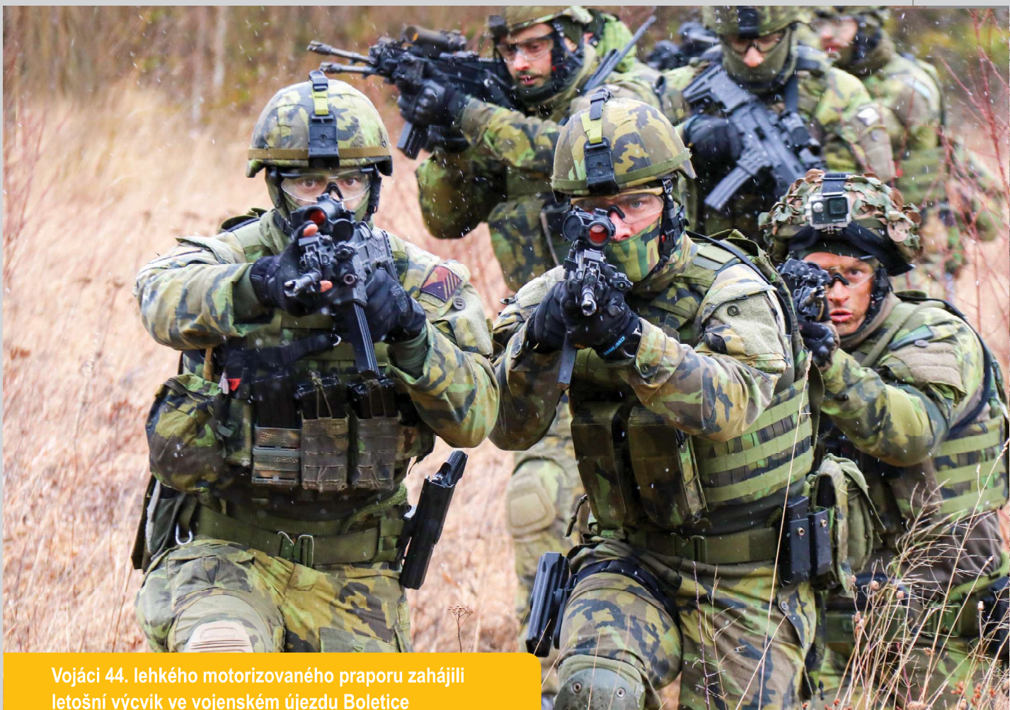
Vojáci 44. lehkého motorizovaného praporu zahájili letošní výcvik ve vojenském újezdu Boletice