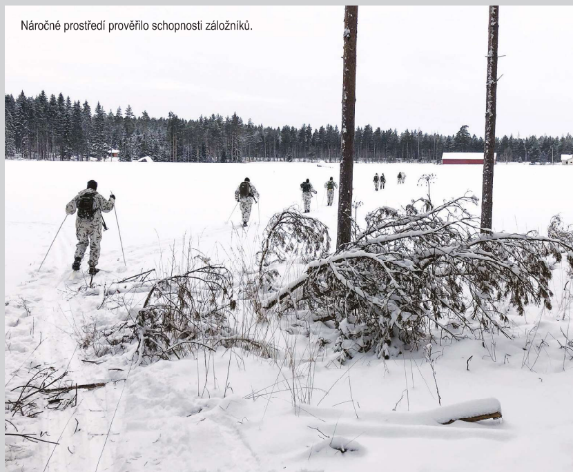
Náročné prostředí prověřilo schopnosti záložníků.

Součástí kurzu byly také různé drobné „vyčtyávky“. Například je velmi znatelný rozdíl, pokud při čekání venku stojíte prostě na sněhu, nebo si pod nohy dáte malý kousek karimatky, dřevo, cokoli, co izoluje. Najednou ztrácíte teplo mnohem pomaleji. Samozřejmě další věc je vyhýbání se pití nebo konzumování čehokoliv studeného, nebo dokonce zmrzlého. Vaše tělo se za každou cenu snaží udržet si teplo, pokud budete konzumovat studené věci, tato regulace se může rychle rozhodit. Snadno si tak můžete zbytečně přivodit průjem, který vás bude dehydratovat, vysilovat a může urychlit podchlazení. Existují i rady, jak si chránit obličej před omrzlinami.