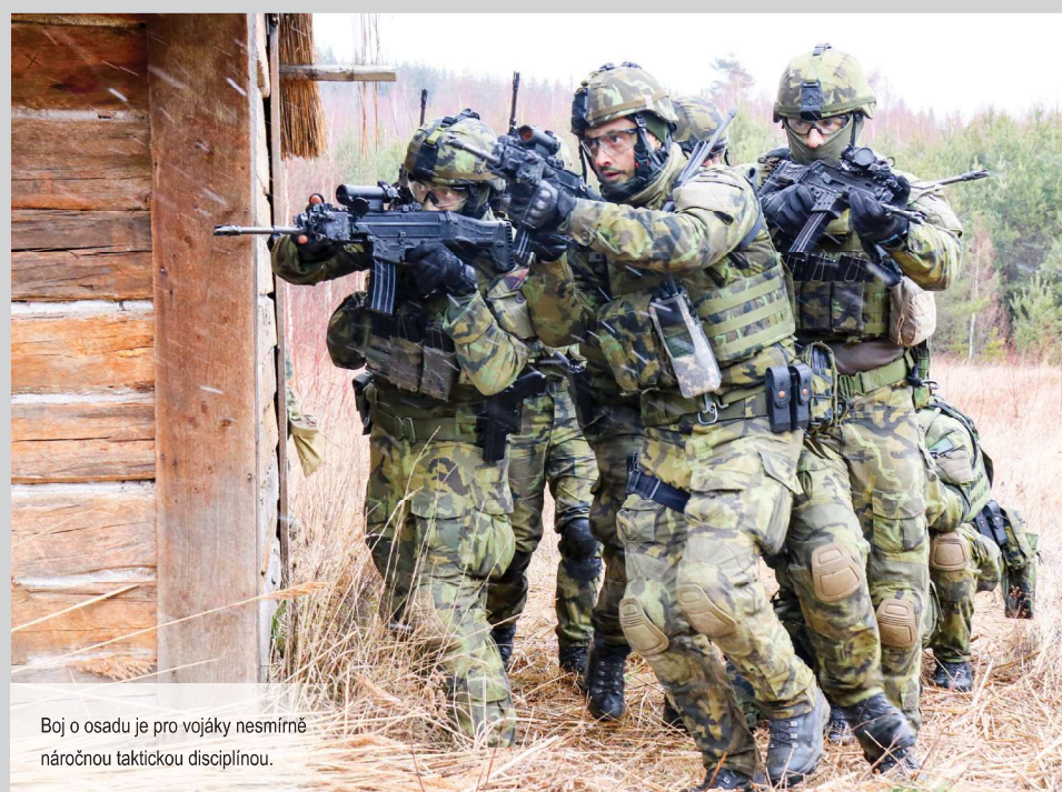
Boj o osadu je pro vojáky nesmírně náročnou taktickou disciplínou.