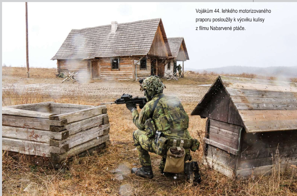
Vojákům 44. lehkého motorizovaného praporu posloužily k výcviku kulisy z filmu Nabarvené ptáče.

potřebovat a na co všechno se musí připravit. Jsou to pro ně zkušenosti, které si musí sami osahat a zažít. Když v noci klesají teploty pod bod mrazu a přes den je i sedmnáct stupňů, v tu chvíli jede každý sám za sebe. Do toho musí plnit úkoly, které dostávají od vyššího stupně velení. Pro naše nováčky je