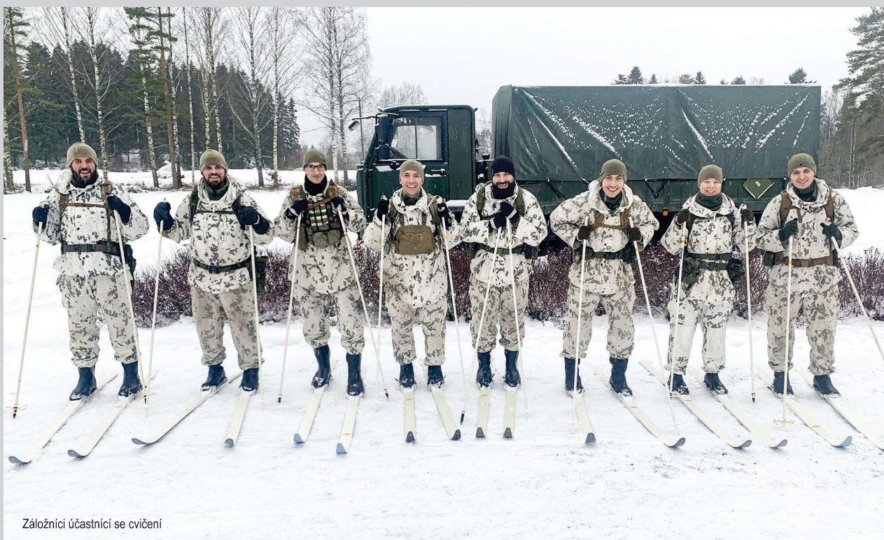
Záložníci účastníci se cvičení

překážkou. Toky a jezera se stávají cestami i pro těžkou techniku. Například 20 cm souvislého ledu pohodlně unese terénní auto a 70 cm tank. Během jedné patroly takto dělali průzkum zamrzlé části jezera navrtáváním, kdy naměřili dostatečnou tloušťku pro osobní vozidlo po celé trase v místě překročení vodní plochy. Další výhodou pro postupující jednotky je silné snížení hluku díky sněhu na větvích stromů. Další způsob, jak mást nepřítele, je postupovat v zástupu, a vytvářet tak pouze jednu stopu s nejasným počtem. Pokud je třeba skrýt směr postupu, je naopak žádoucí udělat mnoho stop a tras, z nichž pouze jedna