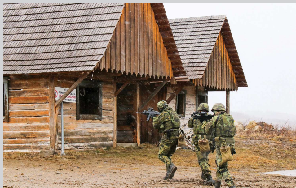
Dalším výcvikem je i následné vyzvednutí jednotky po splnění úkolu.