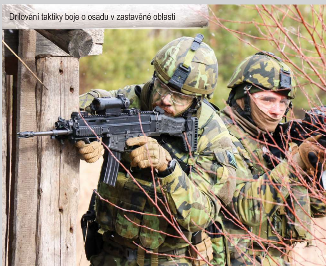
Drilování taktiky boje o osadu v zastavěné oblasti

„Četa dostala od nadřízeného stupně velení úkol zaujmout na určenou zastavenou oblast. Ovládnout vesnici, prohlédnout každou místnost, přesvědčit se o tom, že určené místo už neovládá nepřítel a zabezpečit