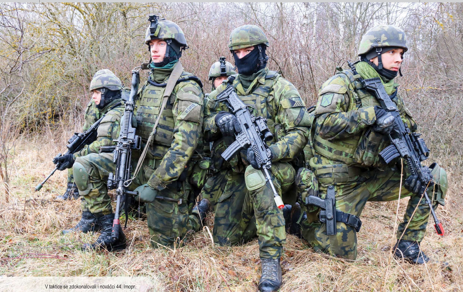
V taktice se zdokonalovali i nováčci 44. Imopr.